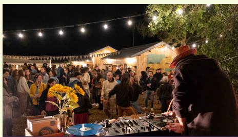
AVRIL, JUIN, AOÛT : LES MARCHÉS FESTIFS

Depuis 9 ans, des collectifs du territoire de la Préalaye se rassemblent pour œuvrer en faveur d'une agriculture et d'une alimentation respectueuses de la nature et du vivant. Ensemble, le Jardin des Mille Pas, l'INRAE - UMR BAGAP, la Maison des semences de Kaol Kozh, les Amis de Perma G'Rennes, La Basse Cour et bien d'autres, ont décidé de créer un moment festif pour élargir leurs réflexions et proposer des moyens d'action au plus grand nombre, au travers de la Fête du Champ à l'Assiette. En 2023, plus de 1000 personnes ont participé à ce temps fort, rythmé par un marché de producteur.ices, des conférences, des ateliers et animations, des balades, des spectacles et concerts !