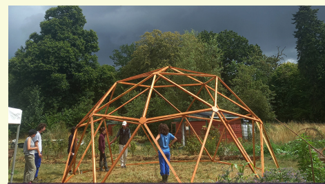
JUILLET : INSTALLATION DU DÔME

Organisée par le Jardin des Mille Pas, la 8 ème édition de la Fête de la Châtaigne a battu son plein pour célébrer les joies de l'automne. Un moment familial et convivial autour de la dégustation de châtaignes grillées, de divers ateliers et d'un marché de producteur.ices locaux, désireux de partager leurs produits et leur passion du métier.