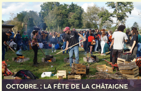
OCTOBRE : LA FÊTE DE LA CHÂTAIGNE

Organisés main dans la main par La Basse Cour et le Jardin des Mille Pas et leurs bénévoles respectifs, la 4 ème , 5 ème et 6 ème édition du Marché Festif ont été de véritables moments de fête et d'échanges autour de l'alimentation saine, accessible et durable. On y retrouve : un marché de produits locaux et des moments de rencontre avec les producteur.ices, des ateliers pour s'approprier des techniques autour de l'alimentation (conservation des aliments, lacto-fermentation, fabrication de pain ...), de l'artisanat local et des ateliers créatifs, et aussi des spectacles et des concerts, pour toute la famille.