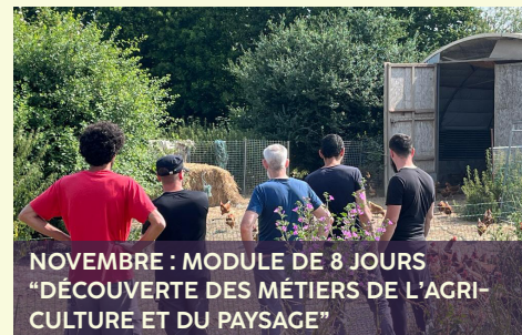
NOVEMBRE : MODULE DE 8 JOURS "DÉCOUVERTE DES MÉTIERS DE L'AGRICULTURE ET DU PAYSAGE"

Le projet répond à plusieurs besoins en offrant tout d'abord un abri lors des animations au jardin, notamment avec les groupes d'enfants, il sert aussi de pépinière pour le Jardin École en étant plus proche des parcelles, et enfin, ce dôme est également utilisé comme espace pour faire pousser des plantes médicinales sous serre.